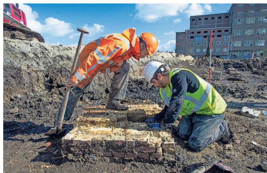
De fundering maakt duidelijk hoe groot oliemolen de Vrijheid was.