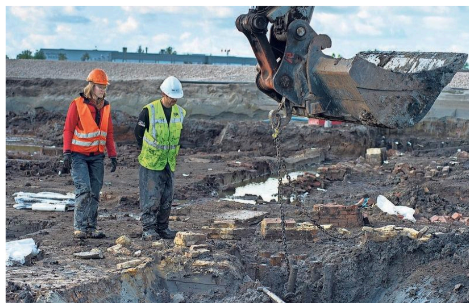
Sommige onderdelen laten de archeologen uit de grond halen.